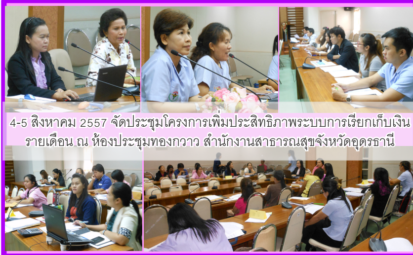
4-5 สิงหาคม 2557 จัดประชุมโครงการเพิ่มประสิทธิภาพระบบการเรียกเก็บเงิน รายเดือน ณ ห้องประชุมทองกวาว สำนักงานสาธารณสุขจังหวัดอุดรธานี