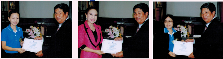
10 มิถุนายน 2557 กรรมการและเจ้าหน้าที่สหกรณ์ เข้าอบรมการให้บริการสู่ความเป็นเลิศ ณ สันนิบาตสหกรณ์แห่งประเทศไทย