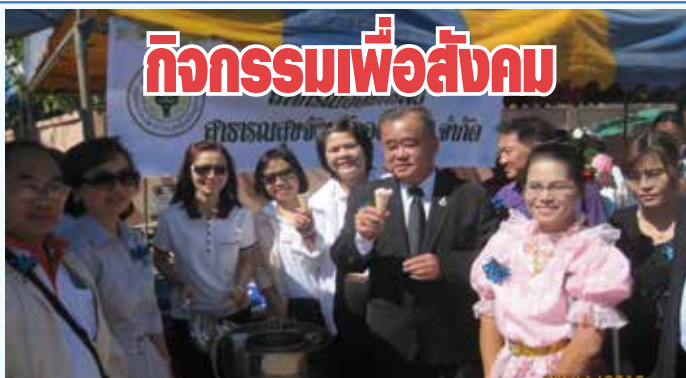
สหกรณ์สนับสนุนการจัดงาน “วันคนพิการสากล” ในวันที่ 17 พฤศจิกายน 2556 ณ สมาคมผู้พิการจังหวัดอุดรธานี