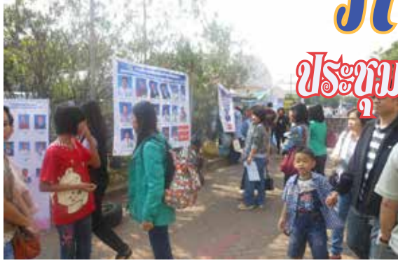
บรรยากาศหน้าหน่วยเลือกตั้ง