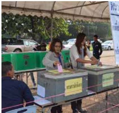
บรรยากาศการเลือกตั้ง