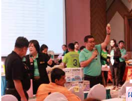
จับรางวัลในที่ประชุมใหญ่