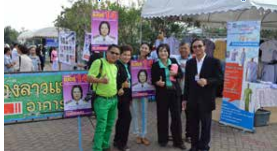
บรรยากาศการทำเสียงเลือกตั้ง