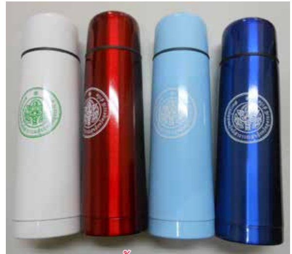
กระติกน้ำร้อนของรางวัล