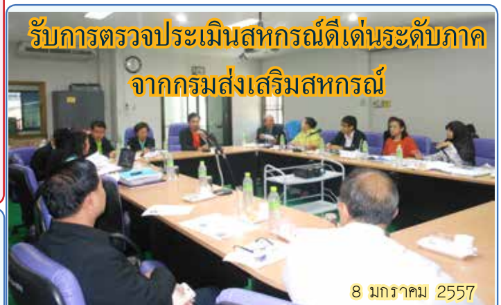
8 มกราคม 2557