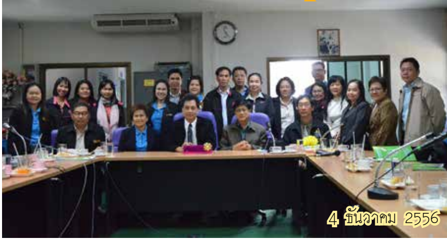
4 ธันวาคม 2556