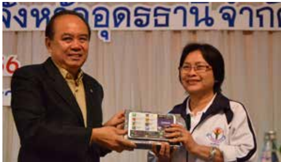
สหกรณ์จังหวัดอุดรธานีมอบของรางวัลแก่ผู้โชคดี