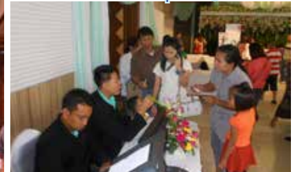
สมาชิกสอบถามข้อมูล