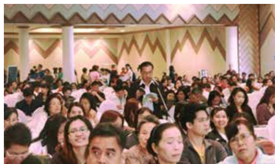
ตัวแทนสมาชิกร่วมสอบถามและแสดงความคิดเห็น