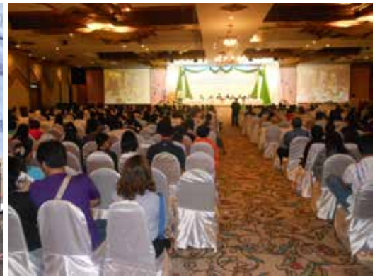
บรรยากาศในที่ประชุมใหญ่