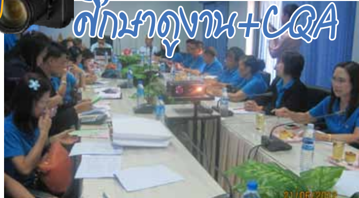
แลกเปลี่ยนเรียนรู้ ณ สหกรณ์ออมทรัพย์สาธารณสุขสกลนคร จำกัด 20-22 มิถุนายน 2556