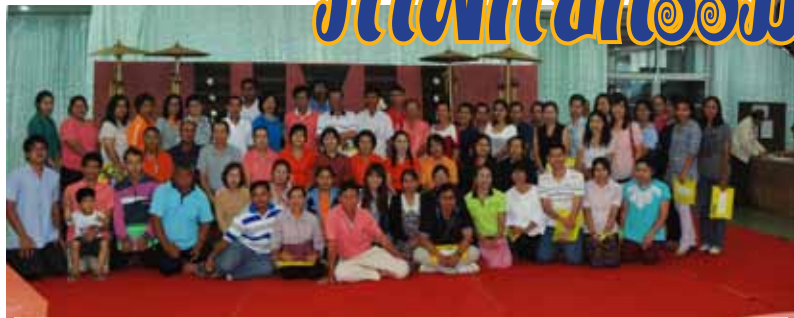
โครงการสหกรณ์พบสมาชิกครั้งที่ 3 ณ โรงพยาบาลบ้านดุง 2 มิถุนายน 2556