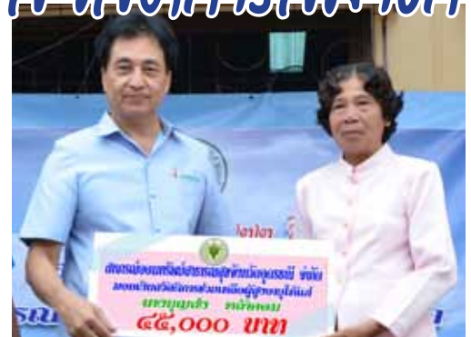
มอบเงินให้แก่สหกรณ์จังหวัดอุดรธานี เพื่อสมทบทุนก่อสร้างอาคารเรียน โรงเรียนบ้านนาหมิ่ง อำเภอสร้างคอม