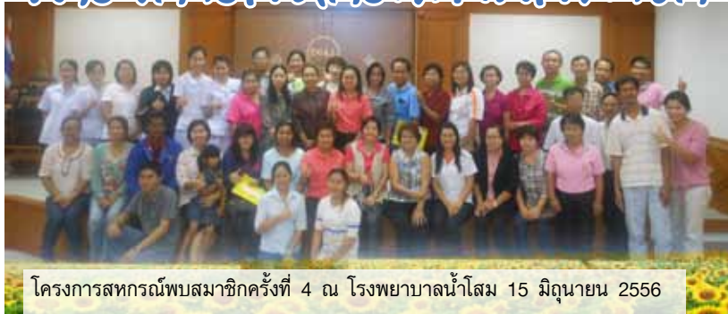
โครงการสหกรณ์พบสมาชิกครั้งที่ 4 ณ โรงพยาบาลน้ำโสม 15 มิถุนายน 2556