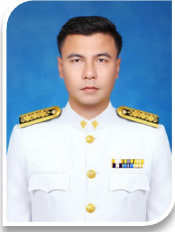
นายณัฐรุส แสงพรหม อุปนายกคนที่ 1