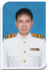
นายเสมอเทพ ศรีทาสร้อย อุปนายกคนที่ 1